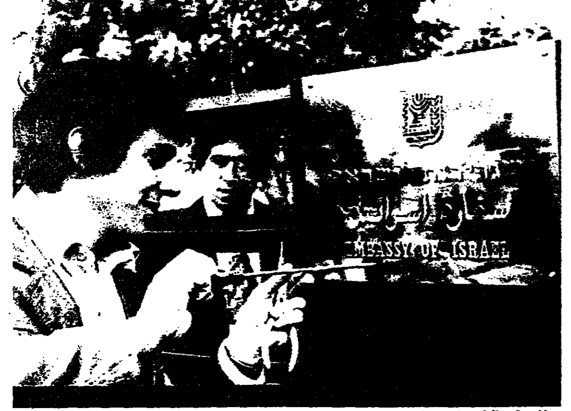
فني اسرائيلي يثبت اللوحة التأسيسية في بوابة السفارة الاسرائيلية في القاهرة قبل بدء مراسم افتتاح اول سفارة اسرائيلية في دولة عربية.

يعين يوضح موقف اسرائيل لماكهنري المنسوب الاميركي يبيد تفهمه للموقف القدس - اجتمع السيد مناحيم يعين رئيس الوزراء امس مع السيد دونالد ماكهنري المنسوب الاميركي الدائم لدى الامم المتحدة، وحضر الاجتماع السيد صموئيل لويس السفير الاميركي لدى اسرائيل، والسيد ابراهيم عبرون سفير اسرائيل لدى الولايات المتحدة. وقال السيد ماكهنري بعد الاجتماع انه استمع الى الموقف الاسرائيلي من رئيس الوزراء وتفهمه، واصفاه ان هذا التصريح بالنسبة له تفهمه كمنسوب لبلاده لدى الامم المتحدة. وقد استقبل رئيس الدولة السيد اسحق رابون المنسوب الاميركي قبل ذلك في مقر رؤساء اسرائيل. البنية على ص ٧٤٨